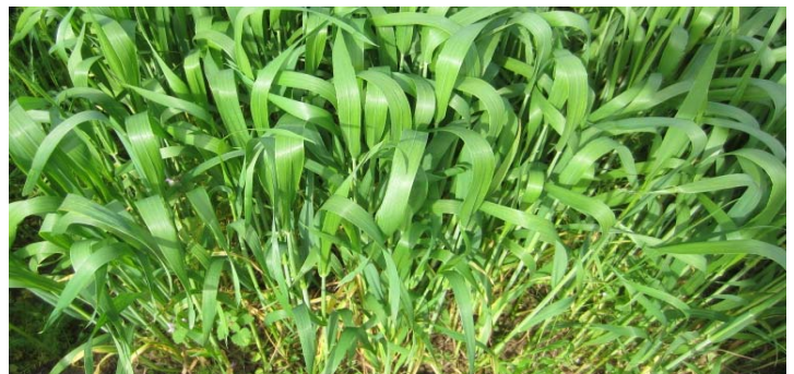
Ideale Blattstellung zur Unkrautunterdrückung